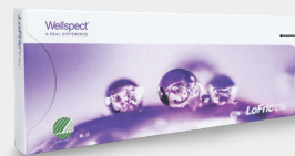
Proefpakket, 5 katheters.

*Effectieve lengte, lengte van de katheter die in de plasbuis kan worden ingebracht.